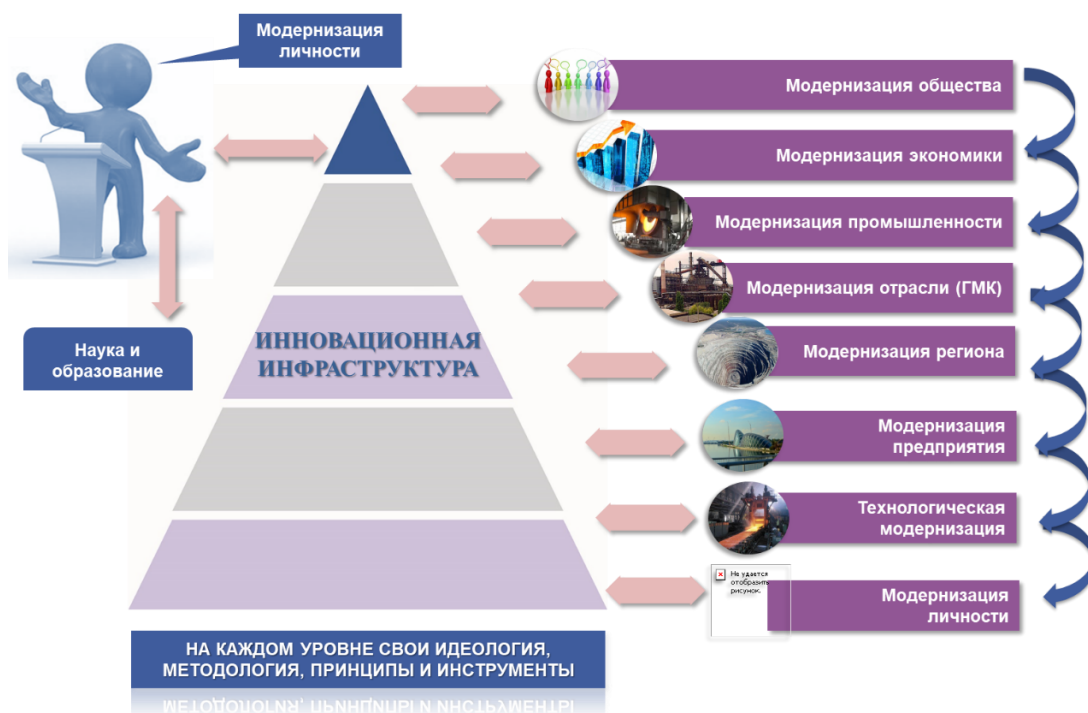
Рис.1. - Уровни модернизации.

С точки зрения теории и методологии модернизации, круг основных вопросов традиционной экономики замыкается на персонаже, индивиде, личности и его личном благе, интересе, однако проблемы, встающие на пути развития человечества, касаются всех и избежать их никому не дано. Об этом обоснованно было высказано в речи бывшего премьер-министра Великобритании Бориса Джонсона на COP-26 в Глазго. Традиционная экономика с её технократическими подходами способна лишить человечество среды обитания, биоразнообразия, природных ресурсов. Имеется необходимость расширения предмета экономической теории и практики, способной мобилизовать необходимые механизмы, которые обеспечили бы будущим поколениям возможность органичной жизни в природе и обществе.