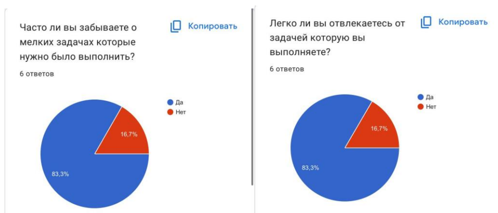
Chart 1 - survey of students speaking more than three languages

We conducted a survey among a small group of students at one of the universities in Astana. The survey revealed the information that a significant percentage of students struggle with concentration during studying and memorizing information. This survey included 6 students who speak more than three languages and 6 students who speak fewer than three languages. The results showed that in the first two diagrams (6 students proficient in less than three languages) 83.3% of students forget about minor tasks that need to be done, while only 16.7% have no issues with minor tasks. The next two diagrams demonstrate that students who speak more than three languages do not get distracted while solving tasks and prove that they have good concentration. Only one out of six students forgets about minor details that needed to be completed.