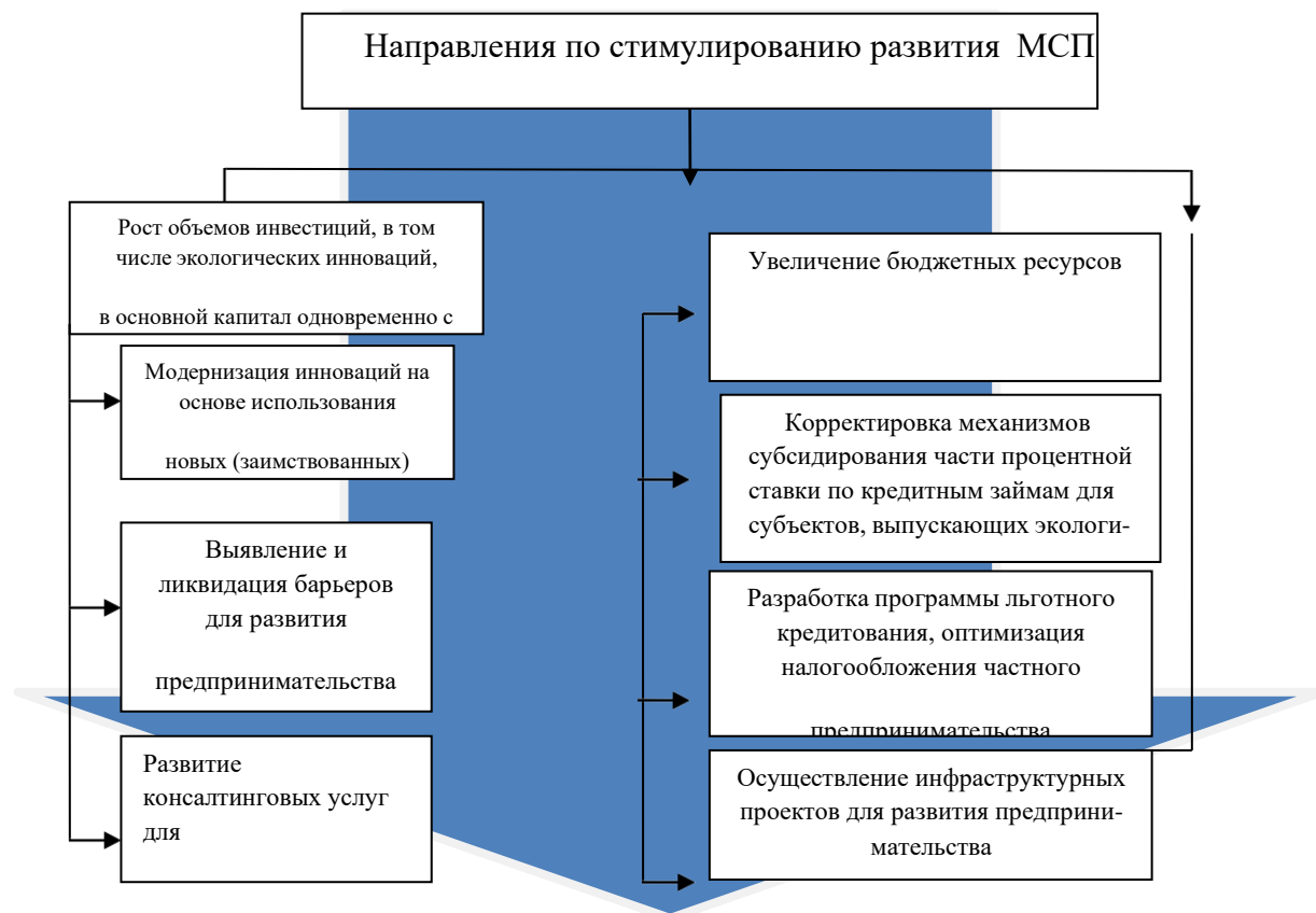
Рисунок 4 –Рекомендации по стимулированию экологического предпринимательства в Казахстане

Следовательно, необходимы меры по соблюдению принципов и приоритетов по достижению положительных результатов в стимулировании предпринимательства (рисунок 4).