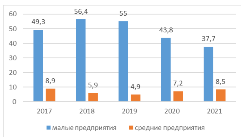
Рисунок 3 – Структура инвестиций малых и средних предприятий, % 9

При этом, необходимо отметить, что объем инвестиций за период 2017-2021 годы в малые предприятия колеблется от 49,3% до 37,7%, что делает основными источниками финансирования только собственные средства и прибыль, однако этих средств очень часто их не хватает, что остро ощущается на всех процессах развития деятельности (рисунок 3) и приводит к привлечению заемных средств, но их доля значительна мала и составляет чуть более 20,0%.