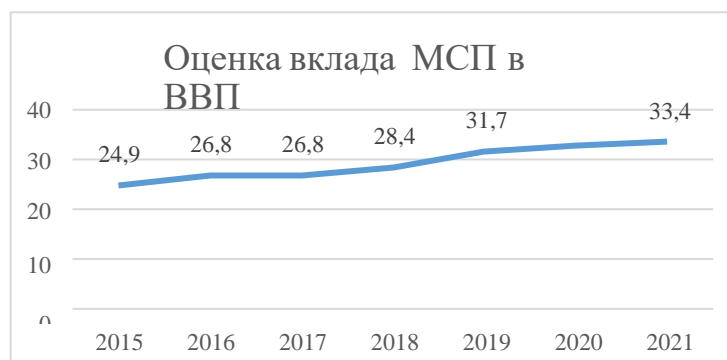
Рисунок 2 – Вклад МСП в ВВП, %

Аналогичные меры поддержки предпринимательства применяли и развитые страны во время пандемии, при этом уровень поддержки предпринимательства в развитых странах во время пандемии занял высокий удельный вес: наиболее высокая поддержка была характерна для Германии - при доле МСП 57% в ВВП уровень поддержки составил 18,7%, Великобритании при МСП 52% поддержка составила 15,6%, США при доле МСП 53% уровень поддержки 13%. Вклад же отечественного бизнеса в ВВП республики составил всего 33,4%, опередив данный показатель 2015 года всего на 8,9% (24,5%) (рисунок 2).